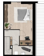
Eerste verdieping | Afgebeeld bouwnummer 1 Bouwnummer 5 is identiek, bouwnummers 3 en 7 zijn geprojecteerd inrook, v.w.