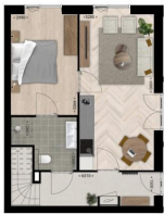
Begane grond | Afgebeeld bouwnummer 1 Bouwnummer 5 is identiek, bouwnummers 3 en 7 zijn geprojecteerd inrook, v.w.