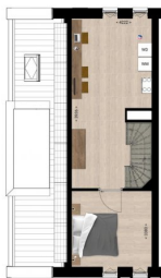
Tweede verdieping | Afgebeeld bouwnummer 2 Bouwnummer 4 is geprojecteerd oppervl. 148